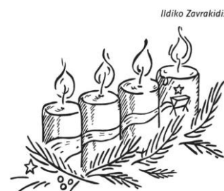
4. Advent: Dem Licht folgen